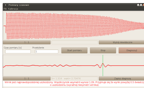
Rys. 2. Okno programu z zaimplementowaną procedurą diagnostyczną – wynik dla silnika uszkodzonego

W przypadku zastosowania procedury w układzie zabezpieczającym, wizualizacja przebiegów nie jest potrzebna.